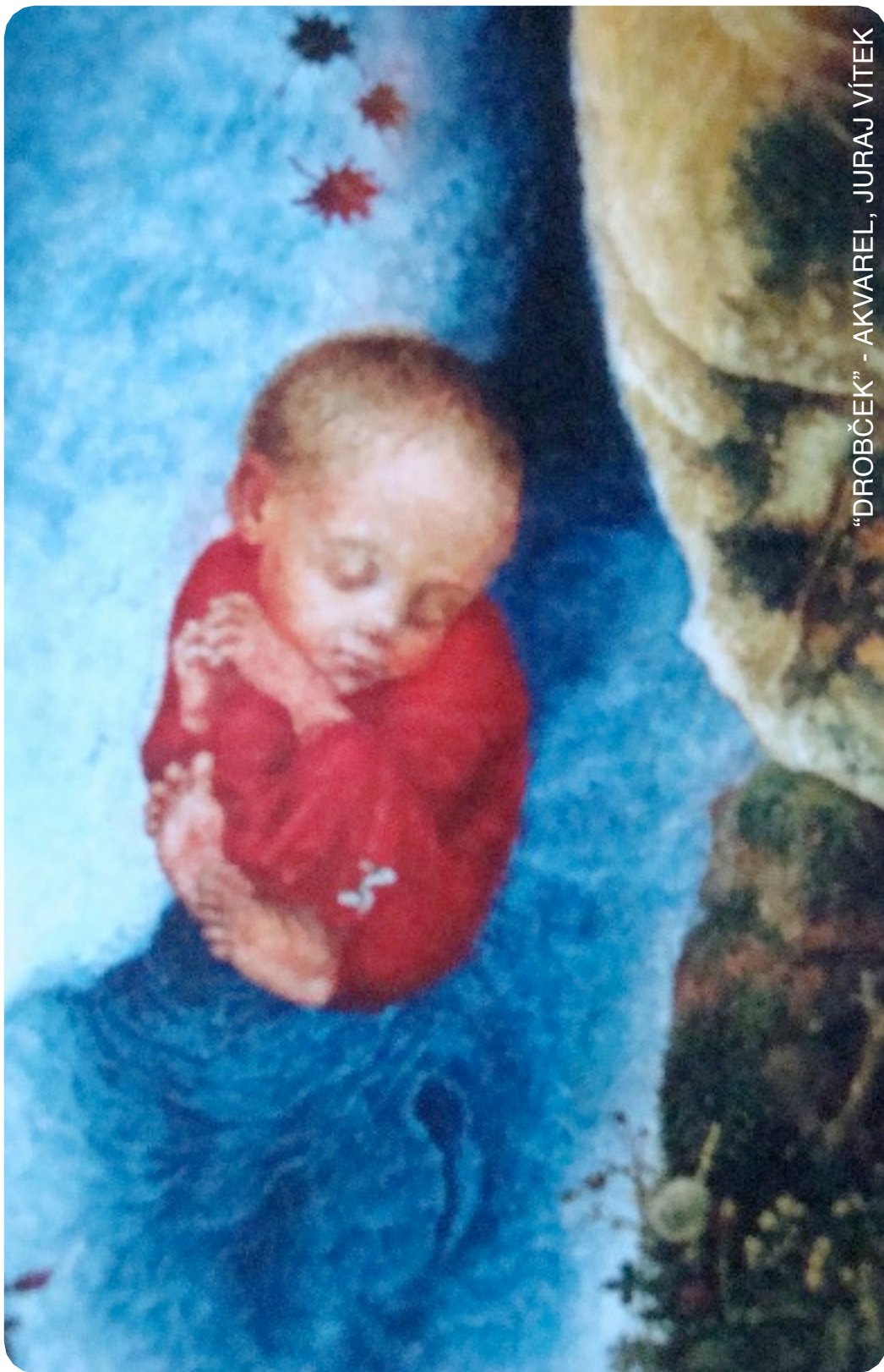
“DROBČEK” - AKVAREL, JURAJ VÍTEK